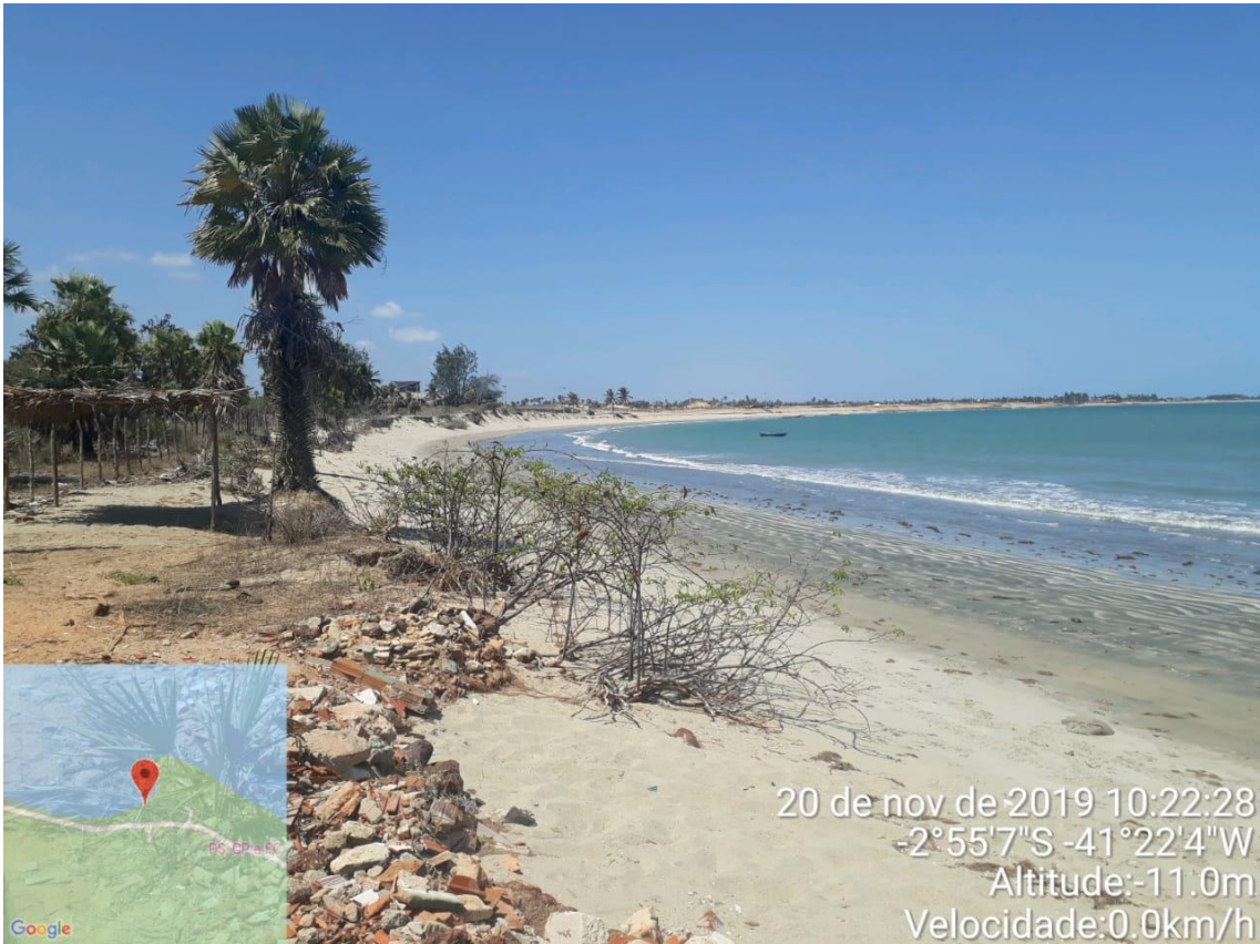
Praia do Cajueiro-PI limpa