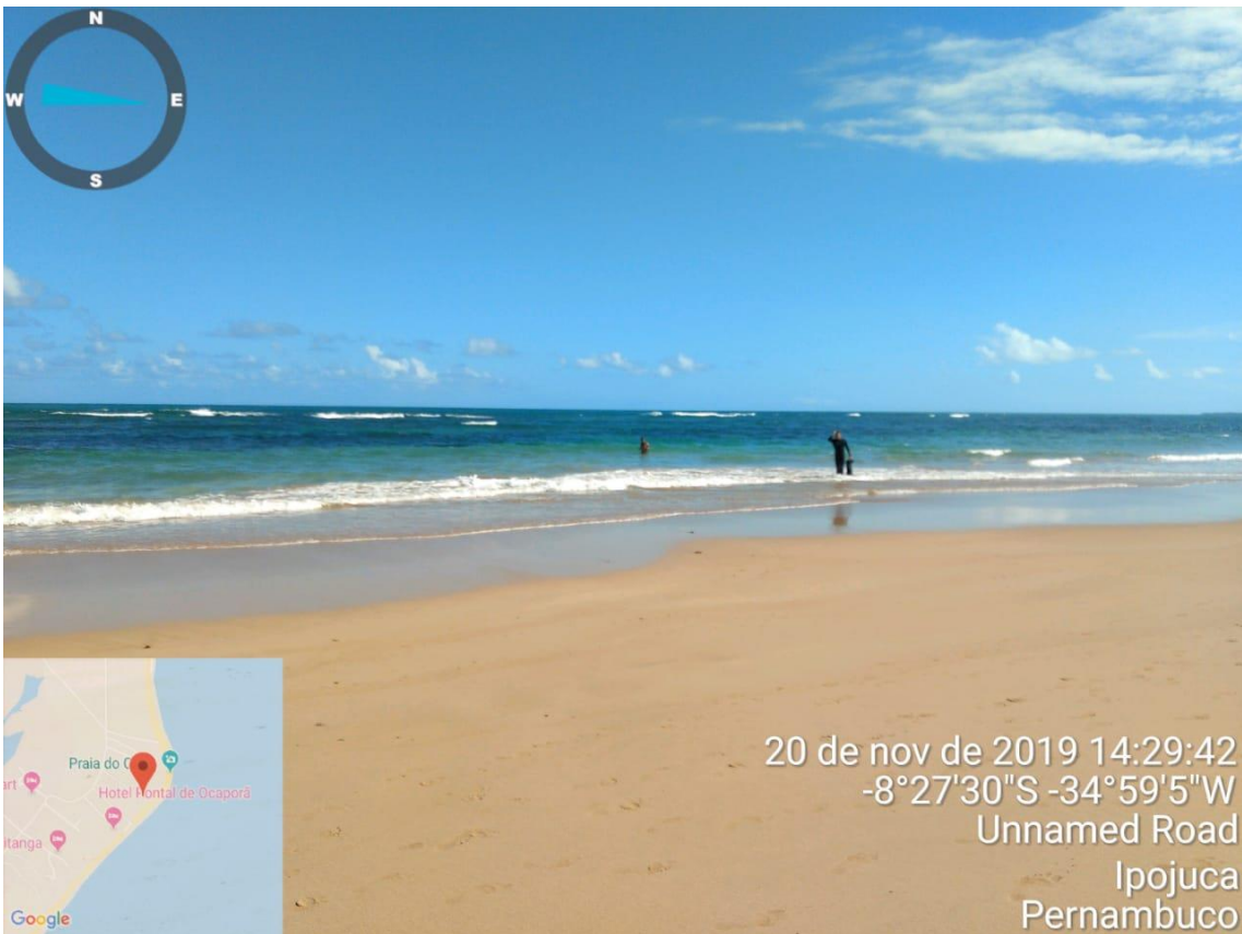
Praia do Cupe-PE limpa