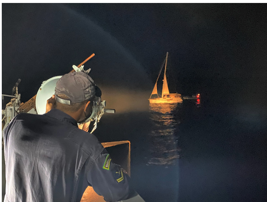
Momento da interceptação do veleiro na madrugada do dia 16 de junho.

Um veleiro carregado com haxixe foi interceptado a mais de 360Km da costa de Recife (PE), por navio da Marinha do Brasil (MB), nesta quarta-feira (16). A operação interagências, entre MB e Polícia Federal, resultou na apreensão de mais de 4 toneladas da droga e na prisão de dois tripulantes da embarcação. Com a troca das informações entre as instituições, autoridades estrangeiras e o Centro Integrado de Segurança Marítima (CISMAR), da Marinha, foi possível identificar o navio veleiro que teria partido do continente europeu.