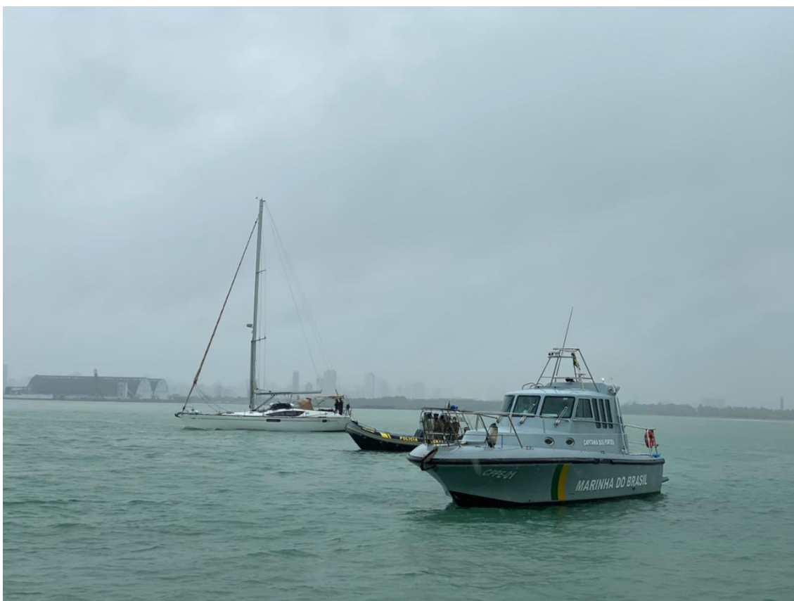
Veleiro sendo escoltado para atracação no Porto de Recife

A interoperabilidade entre as instituições tem sido intensificada pela Marinha com a utilização do Sistema de Gerenciamento da Amazônia Azul (SisGAAz), que está amplamente conectado às redes da Polícia Federal, do Instituto Brasileiro do Meio Ambiente e dos Recursos Naturais Renováveis, da Receita Federal, da Petrobras, entre outros órgãos e empresas capazes de fomentar e compartilhar mais rapidamente as informações pertinentes e necessárias para a proteção da “Amazônia Azul”, e tem como missão monitorar e controlar de forma integrada a região de busca e salvamento e as demais áreas de interesse estratégico no Atlântico Sul, representando cerca de 22 milhões de km 2 . A atuação conjunta tem o intuito de assegurar a proteção ao meio ambiente e a segurança nas fronteiras marítimas, em especial, na repressão a crimes transnacionais como o tráfico internacional de drogas.