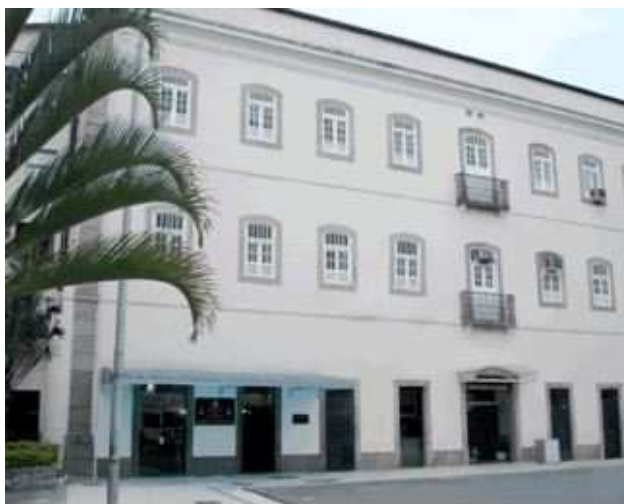
Serviço de Seleção do Pessoal da Marinha (SSPM)

Serviço de Seleção do Pessoal da Marinha (SSPM) - Responsável pelo planejamento, execução e coordenação das atividades de recrutamento necessárias à captação de pessoas para o ingresso voluntário na MB, à exceção dos Concursos do Corpo de Fuzileiros Navais (CFN); e responsável por exercer as atividades de sua competência na execução dos concursos públicos para ingresso na MB, dos concursos internos e exames para acesso na carreira, além dos processos seletivos determinados pela Administração Naval. Também é responsável pelo planejamento e execução das avaliações psicológicas necessárias para selecionar candidatos para ingresso nas carreiras da MB.