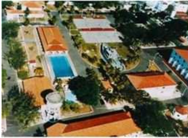
Escola de Aprendizes-Marinheiros da Ceará