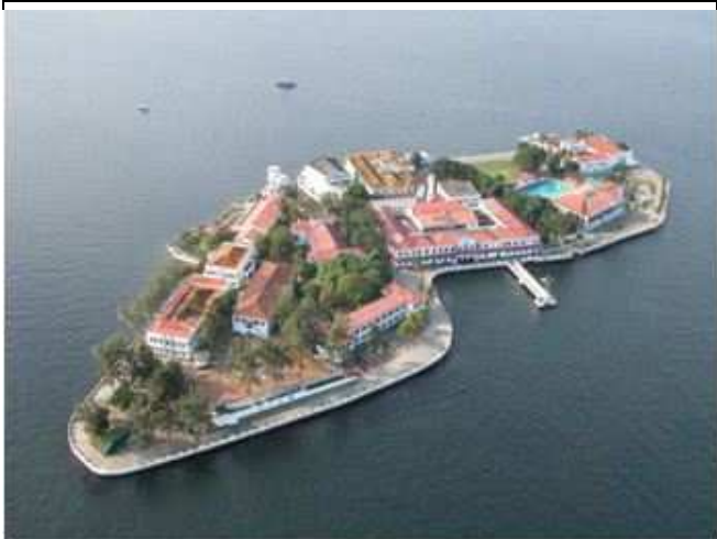
Centro de Instrução Almirante Wandenkolk

Centro de Instrução Almirante Wandenkolk (CIAW) - Responsável pela condução do Curso de Formação de Oficiais, oriundos do meio civil, para o Corpo de Saúde, Corpo de Engenheiros Navais, Quadro Complementar, Quadro Técnico e Quadro de Capelães Navais, selecionados por meio de concurso público. O CIAW é responsável, também, pelos Cursos de Especialização e Aperfeiçoamento de Oficiais, em nível de pós-graduação, e pelos Cursos Especiais e Expeditos destinados a preparar Oficiais para o exercício de funções específicas técnico-profissionais, conforme as necessidades da Marinha.