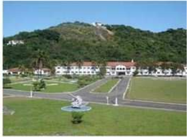
Escola de Aprendizes-Marinheiros do Espírito Santo