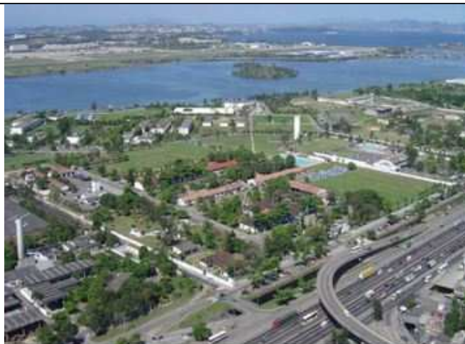
Centro de Instrução Almirante Alexandrino

Centro de Instrução Almirante Alexandrino (CIAA) - Responsável por ministrar cursos de Especialização e Aperfeiçoamento de Praças, Habilitação de Sargentos e Suboficiais, e Qualificação Técnica Especial. Também conduz Cursos Especiais e Exeditos para Praças. Ministra, também, o Curso de Formação de Cabos do Corpo Auxiliar de Praças (CAP), para candidatas do Ensino Técnico de Nível Médio que ingressaram por meio de um concurso específico, visando a formação militar-naval do aluno possuidor de formação profissional técnica, capacitando-o para o exercício de suas funções no Serviço Ativo da Marinha.