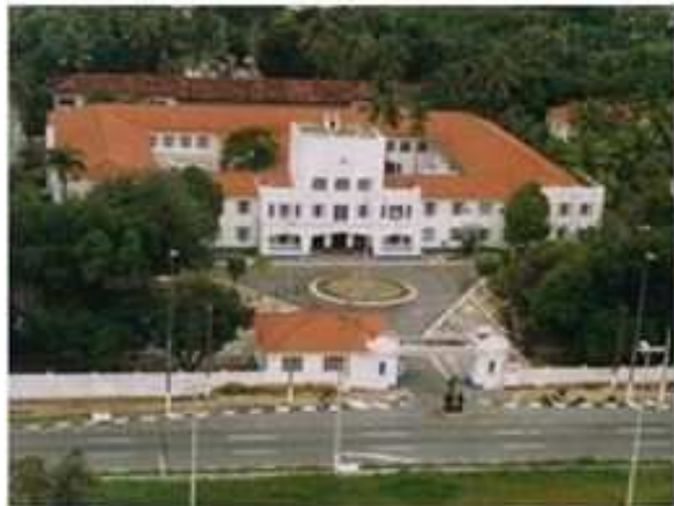
Escola de Aprendizes-Marinheiros de Pernambuco