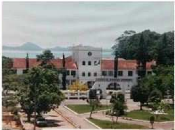
Escola de Aprendizes-Marinheiros de Santa Catarina