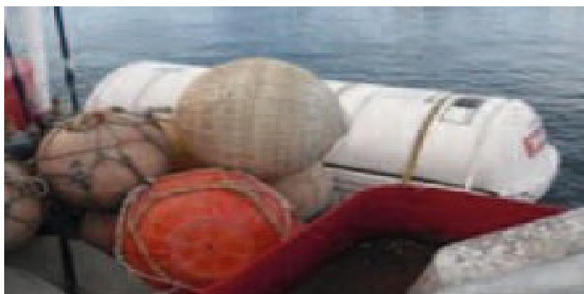
Figura 1 – Acesso obstruído a equipamento de salvatagem

b) A localização e operação dos equipamentos de salvatagem devem ser adequadas, garantindo que o acesso a eles é livre de obstrução e que operam a contento (Figura 1).