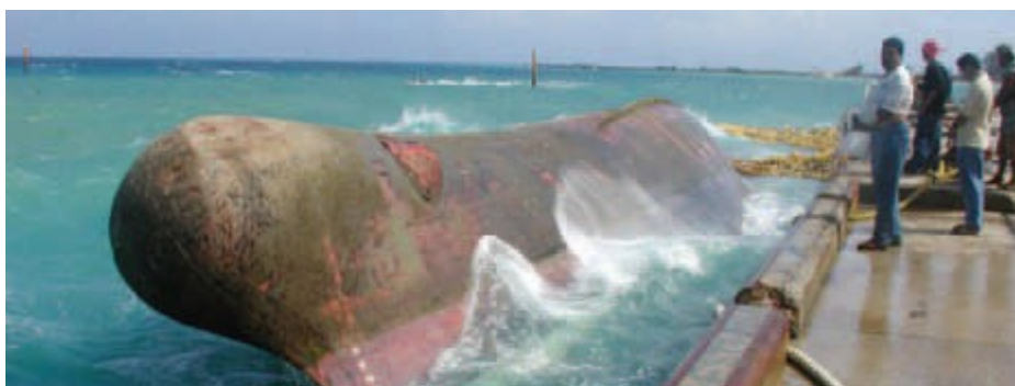
Figura 3: Barco de pesca emborcado

É crucial para os Comandantes terem conhecimento das condições meteorológicas prevaescentes ou previstas bem como qual é o estado do mar, de modo a determinar se sua embarcação será capaz de suportar tais condições quando navegando.