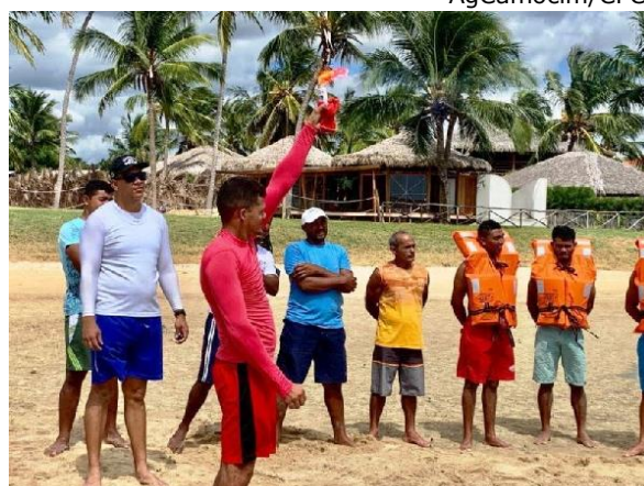
Aula do curso em Itarema.

Após a realização do curso, foram entregues os certificados de conclusão e as Cadernetas de Inscrição e Registro (CIR) para 29 alunos que concluíram o curso com êxito. A solenidade contou com a presença de familiares dos pescadores, autoridades civis do município e militares da AgCamocim.