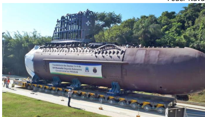
Translado das seções 3 e 4 do Submarino Humaitá .

A ICN – Itaguaí Construções Navais concluiu no dia 19 de junho a transferência das seções do Submarino Humaitá (S41) da fábrica para o estaleiro, dando início a fase final de preparação para a união final de todas as seções, formando o casco resistente da embarcação. As seções 3 e 4 representam a parte de vante do submarino, abrigando importantes elementos como a sala