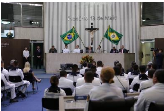
Sessão solene na Assembleia Legislativa do Ceará.