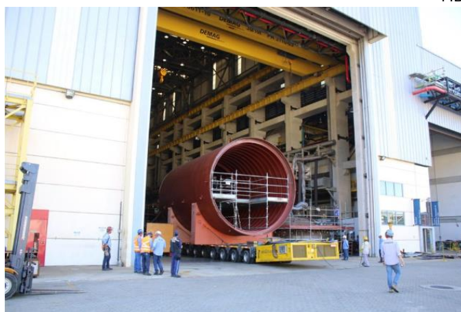
Movimentação de seções do submarino Angostura .

A Itaguaí Construções Navais - ICN realizou a movimentação do casco resistente das seções 2B e 2A do submarino SBR-4 ( Angostura ), da NUCLEP para a UFEM, um trajeto rápido de 30 minutos realizado em duas etapas: Primeiro foi movimentada a seção 2B pesando aproximadamente 70 toneladas e 10 metros de