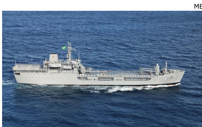
NDCC Garcia D'Ávila .

Foi adquirido pela Marinha do Brasil e recebido em 4 de dezembro de 2007, em Portsmouth, Reino Unido. A incorporação à Armada ocorreu no dia 29 de maio de 2008, em cerimônia realizada no Complexo Naval de Mocanguê, na cidade de Niterói, Rio de Janeiro. O NDCC Garcia D'Ávila foi o terceiro navio da Marinha do Brasil a ostentar esse nome em homenagem ao Capitão-de-Fragata Garcia D'Ávila Pires de Carvalho e Albuquerque, desaparecido no afundamento do Cruzador Bahia, que comandava em 1945.