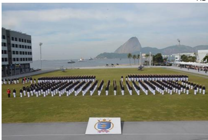
Turma Patriarca da Independência.

No dia 8 de junho, em cerimônia solene, os Aspirantes da Turma “Patriarca da Independência” realizaram o juramento à Bandeira Nacional e receberam os Espadins, símbolo do compromisso que assumem com a Marinha. A cerimônia foi presidida pelo Ministro de Estado da Defesa, General de Exército Fernando Azevedo e Silva, e contou com a presença do Comandante da Marinha, Almirante de Esquadra Ilques Barbosa Junior, e de diversas autoridades militares e civis.