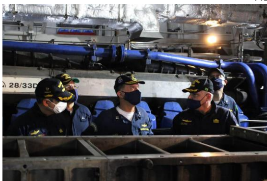
A bordo de navio subordinado ao Com3DN.