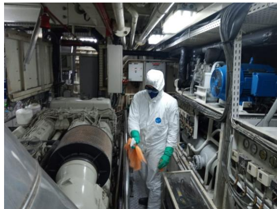
Desinfecção no passadiço de máquinas.