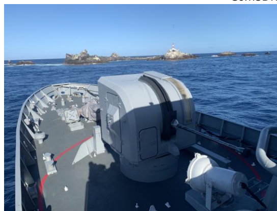
Vista do arquipélago, de bordo do NPa Macau .

O Arquipélago de São Pedro e São Paulo é um conjunto de ilhéus localizado a uma distância de 987 Km da cidade de Natal. Garante ao Brasil 450 mil quilômetros quadrados de área marítima em seu entorno, na qual o