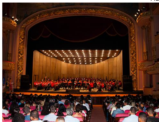
Banda Sinfônica do CFN.

O espetáculo, dividido em duas fases, contemplou trilhas sonoras de filmes clássicos do cinema, como "Star Wars", "A Lista de Schindler" e "E.T.", contando com a participação das gaitas de fole da Banda Marcial do CFN, do coro do CFN e do coro feminino de oficiais da Marinha. Representando o cinema nacional, o cantor Daniel fez uma participação especial no dia 4 de abril, empolgando o público com a canção "O Menino da Porteira", tema do longa-metragem homônimo, além de sucessos como "Adoro Amar Você", "Estou Apaixonado" e "Romaria".