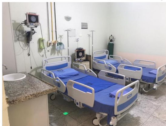
Novos leitos disponíveis no HGEF.

As melhorias realizadas irão aperfeiçoar os tratamentos clínicos e terapêuticos ofertados no Ceará, disponibilizando para militares, servidores civis, dependentes e pensionistas da Marinha do Brasil um atendimento ainda mais eficaz no enfrentamento à COVID-19, reforçando, assim, o compromisso com a Família Naval.