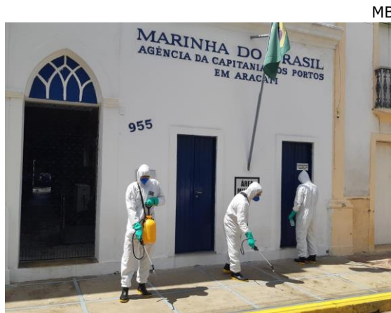
Desinfecção na AgAracati.

No dia 18 de maio, a ação aconteceu na Agência da Capitania dos Portos em Aracati (AgAracati), como parte da Operação "Grande Muralha", da Marinha do Brasil. Como ação de prevenção, foram desinfectadas instalações e materiais da AgAracati, bem como foi realizada instrução para a tripulação sobre como manter os ambientes higienizados. Nas duas oportunidades, foram empregados militares habilitados para a desinfecção de ambientes, material e pessoal, em Estágios de Capacitação ministrados pela Equipe de Resposta Nuclear, Biológica, Química e Radiológica do Comando do 3º Distrito Naval.