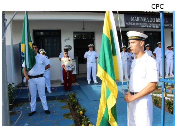
"Bandeirão" em Camocim

E m comemoração pelo transcurso do 153º Aniversário da Batalha Naval do Riachuelo, Data Magna da Marinha, a Agência da Capitania dos Portos do Ceará em Camocim, realizou no dia 7 de junho, o Cerimonial à Bandeira narrado. O evento, também conhecido como "Bandeirão", contou com a participação de alunos da Escola de Educação Fundamental Alba Maria de Araújo Lima Aguiar e militares do Exército Brasileiro. A cerimônia proporcionou aos presentes um momento de aprendizado sobre as tradições navais e a história da Bandeira Nacional.