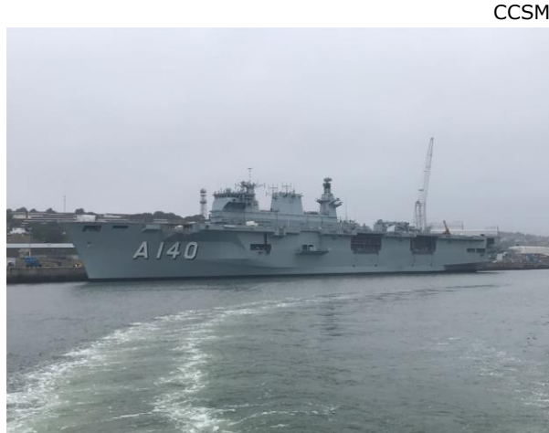
Visão geral do costado

E m imagens liberadas pelo Centro de Comunicação Social da Marinha do Brasil, registra-se os avanços das adaptações realizadas no PHM Atlântico, adquirido à Marinha Real inglesa e com previsão de chegada ao País, em agosto de 2018. No escopo das adaptações e vistorias no navio, que está em processo de transferência, será realizada no dia 29 de junho a Mostra de Armamento. As adaptações estão sendo realizadas por estaleiros britânicos na Base Naval de Devonport em Plymouth.