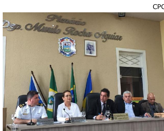
Sessão na Câmara de Vereadores