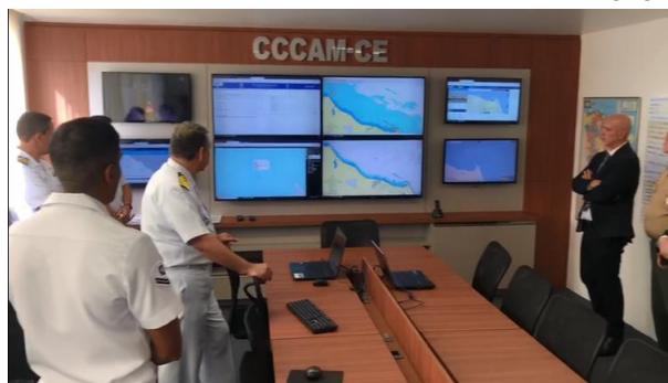
Sala do CCCAM.