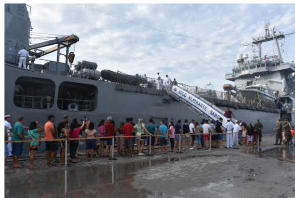
Visitantes do NDCC Almirante Saboia em Fortaleza.