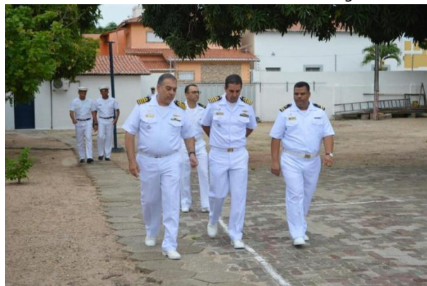
Visita à AgCamocim.