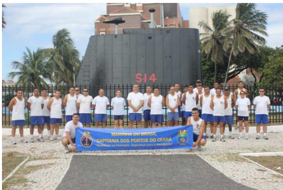
CMG Madson e tripulação da CPC-CE

Em suas palavras, o Presidente da SOAMAR-CE salientou a importância da iniciativa da Marinha em viabilizar a revitalização e o plantio das árvores: "O plantio de árvores é cultuado em todo o mundo, em termos de cidadania. É muito adequado que estejamos hoje na praça Amigos da Marinha, depois de reformada, graça ao trabalho dos marinheiro aqui presentes, para festejarmos o dia do Meio Ambiente. Que daqui há alguns anos possamos lembrar deste dia. Que as árvores frondosas estejam aqui também para testemunhar, historicamente, o que fizemos hoje. A SOAMAR-CE agradece a todos vocês que realizaram este excelente trabalho de recuperação da praça."