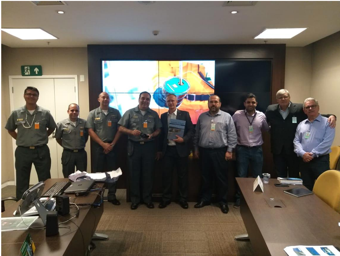
Sede Administrativa da Petrobrás em Santos