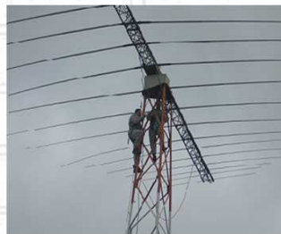
Manutenção em Antenas e Equipamentos