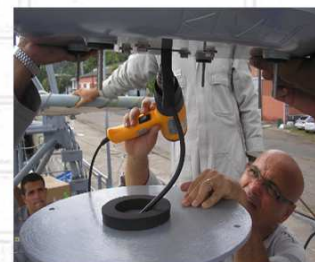
Equipe de Apoio Técnico

É um serviço prestado pela ERMS, visando apoiar as OM da área do Com2ºDN, em relação a pequenos reparos, a instalação e manutenção de equipamentos de comunicações e ao adestramento das Equipes das OM apoiadas.