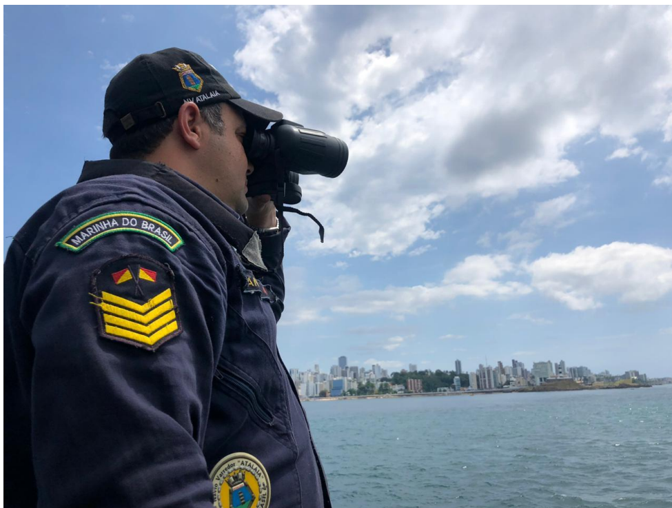
Militares monitoram faixa litorânea do Farol da Barra-BA