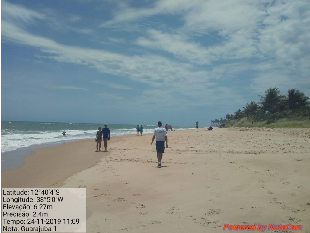
Praia Guarajuba-BA limpa