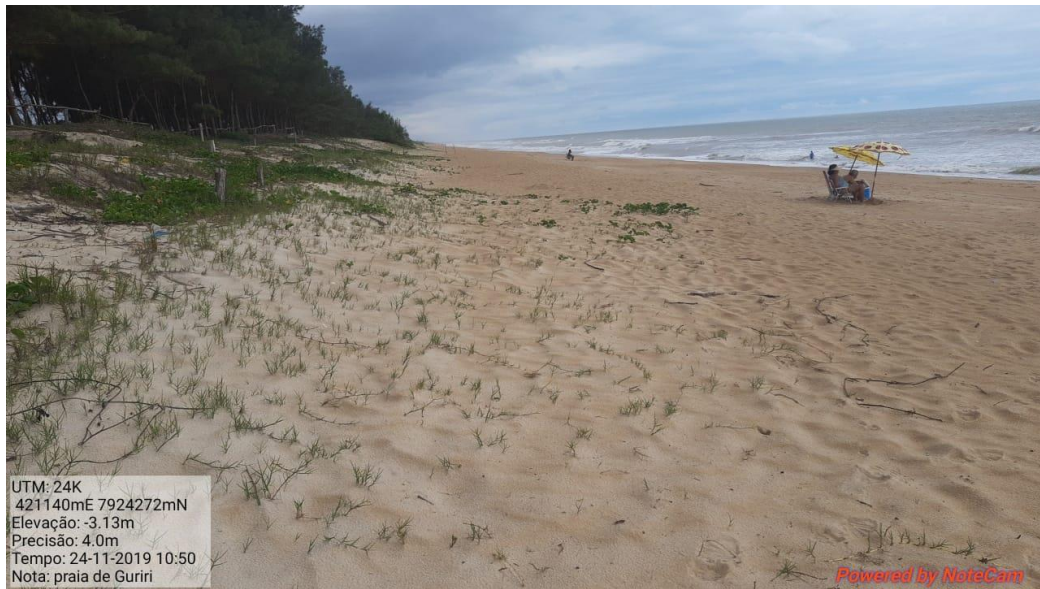
Praia de Guriri-ES limpa