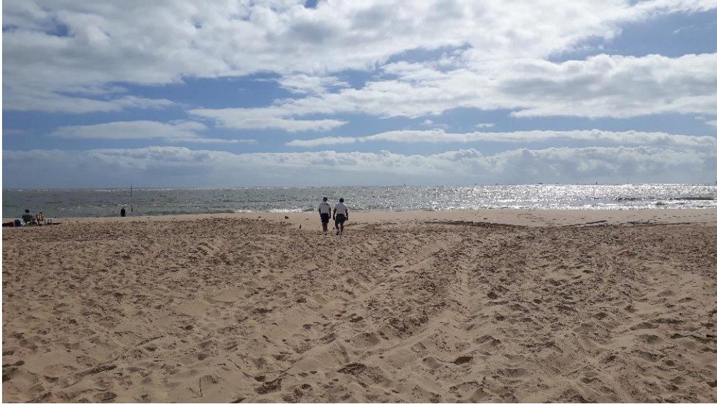
Praia de Coroa do Meio-SE limpa