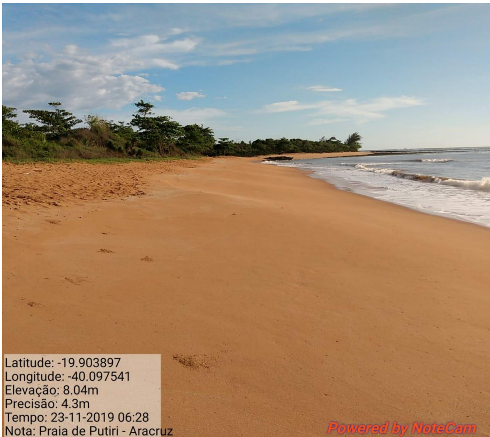
Praia de Putiri-ES limpa