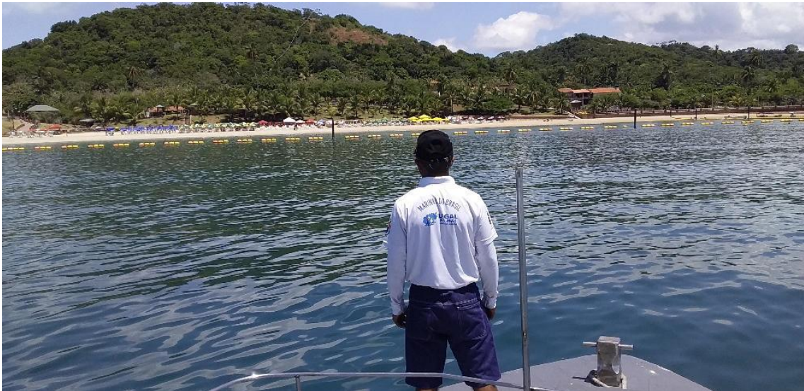
Militares realizam monitoramento na Ilha dos Frades - BA limpa