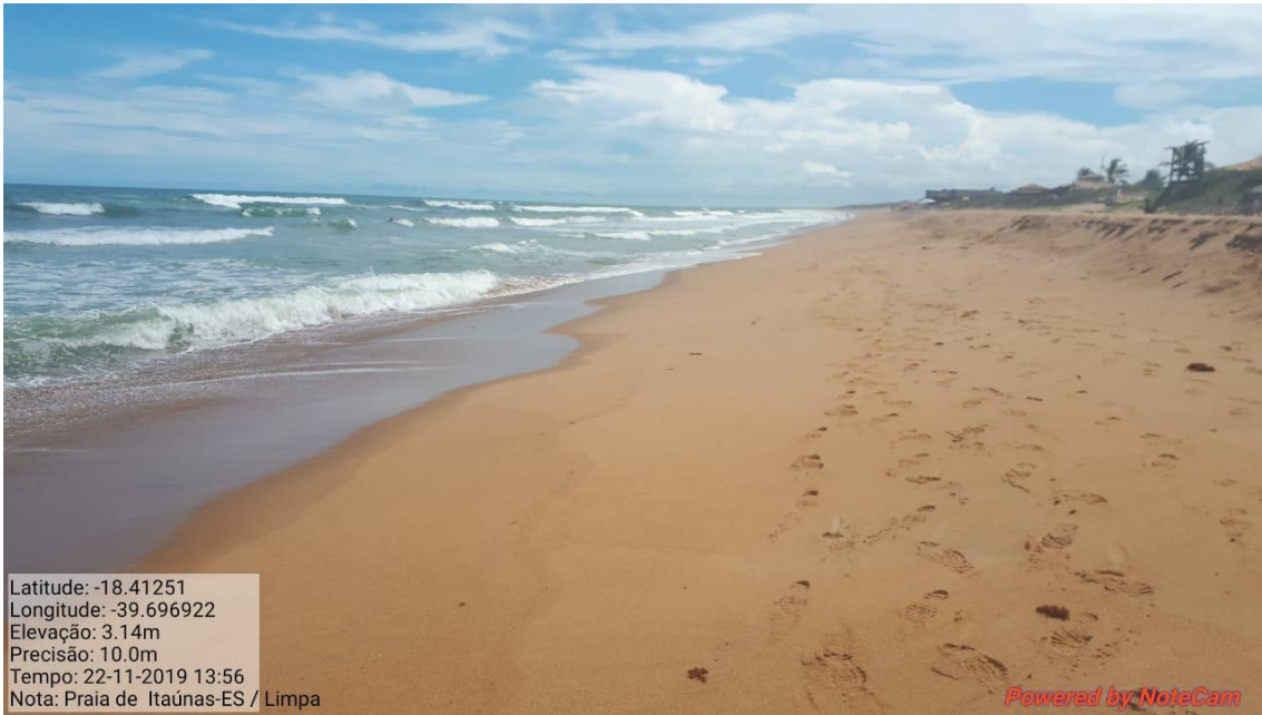
Praia de Itaúnas-ES limpa