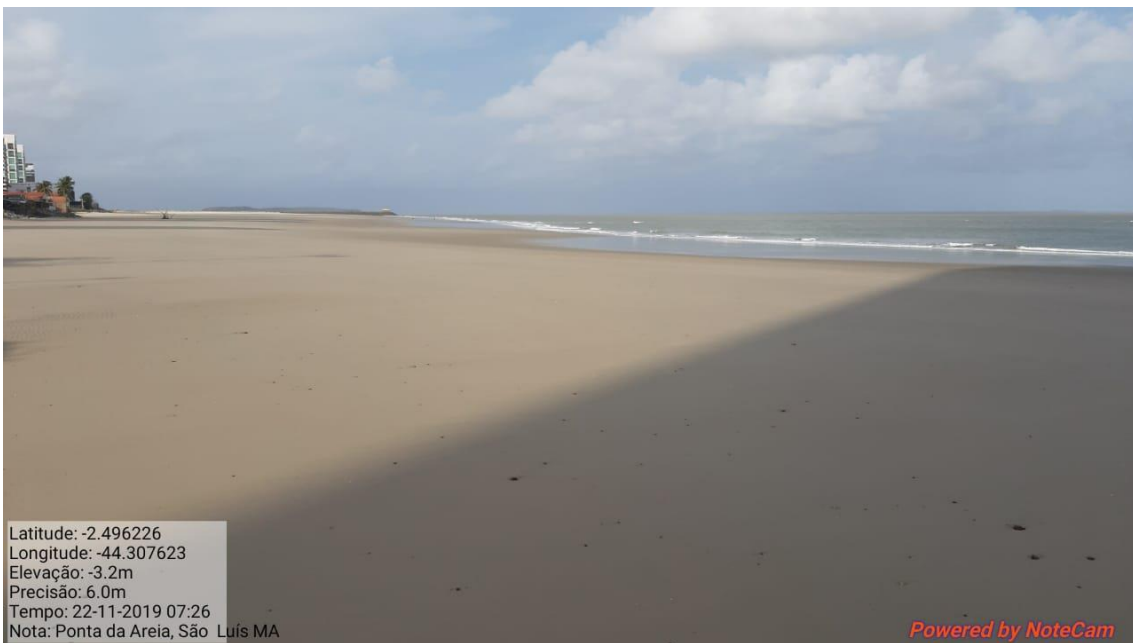
Praia da Ponta da Areia-MA limpa