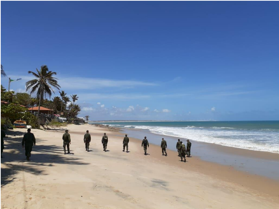
Praia da Taíba-CE limpa