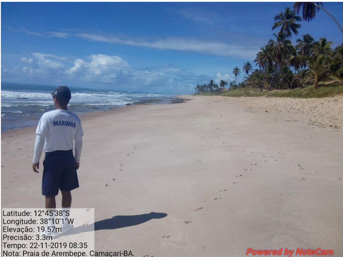
Praia de Arembeque-BA limpa