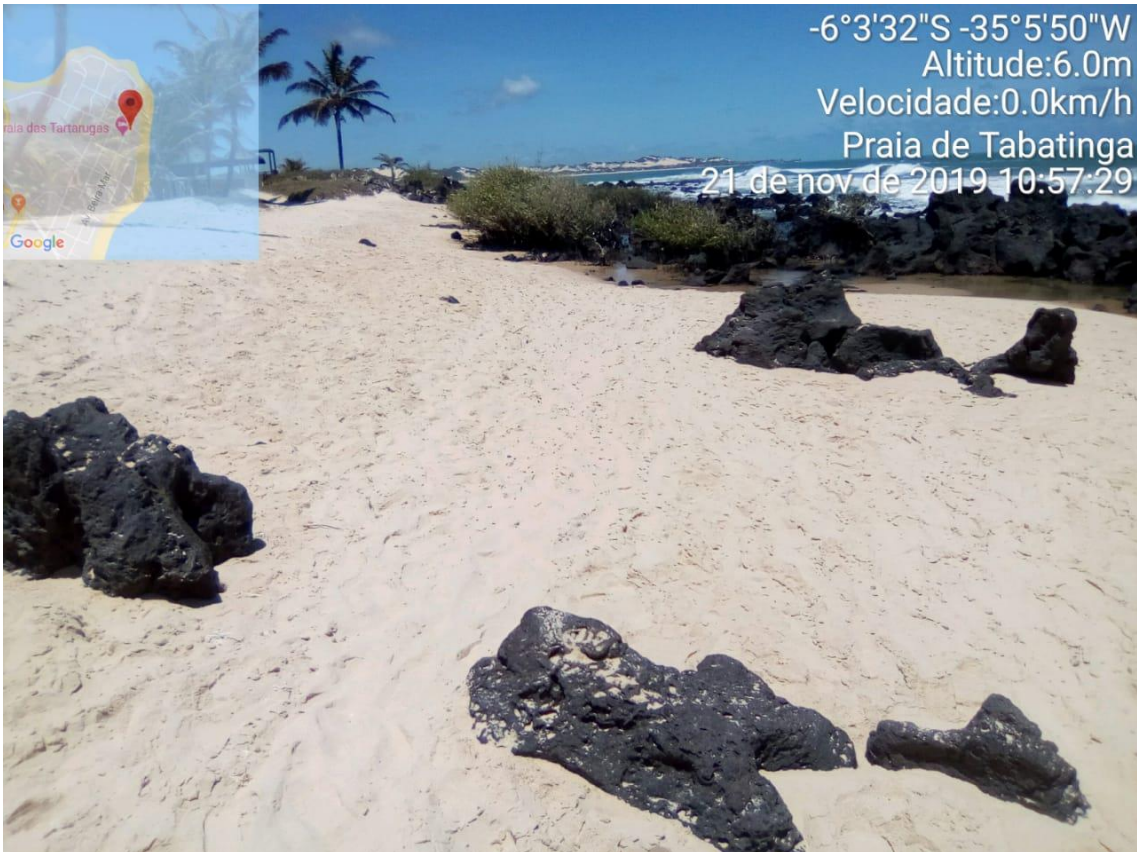
Praia de Barra de Tabatinga-RN limpa