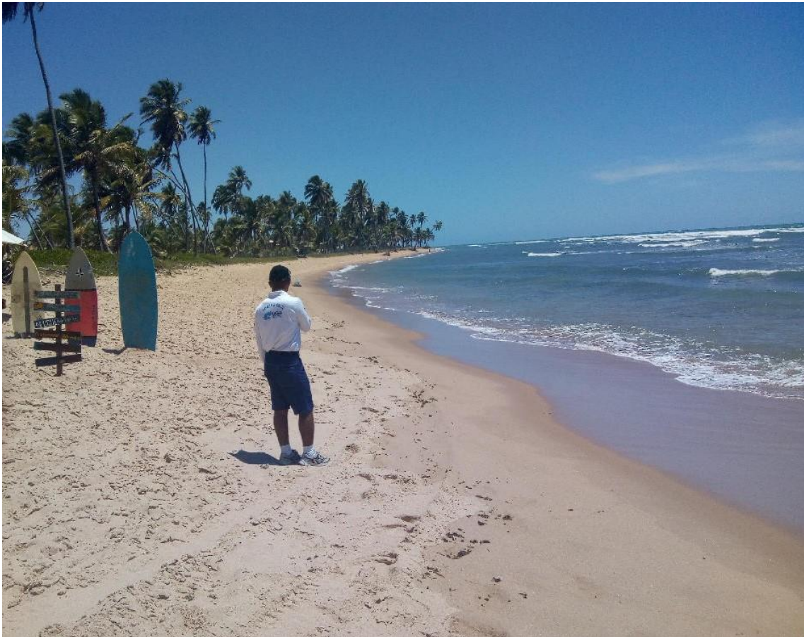
Praia do Forte-BA limpa