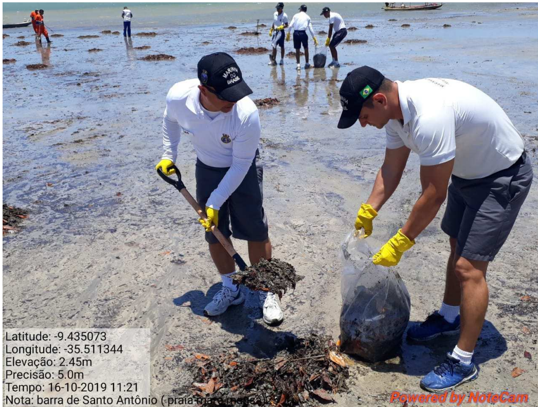
5. Limpeza na Praia de Santo Antônio – AL