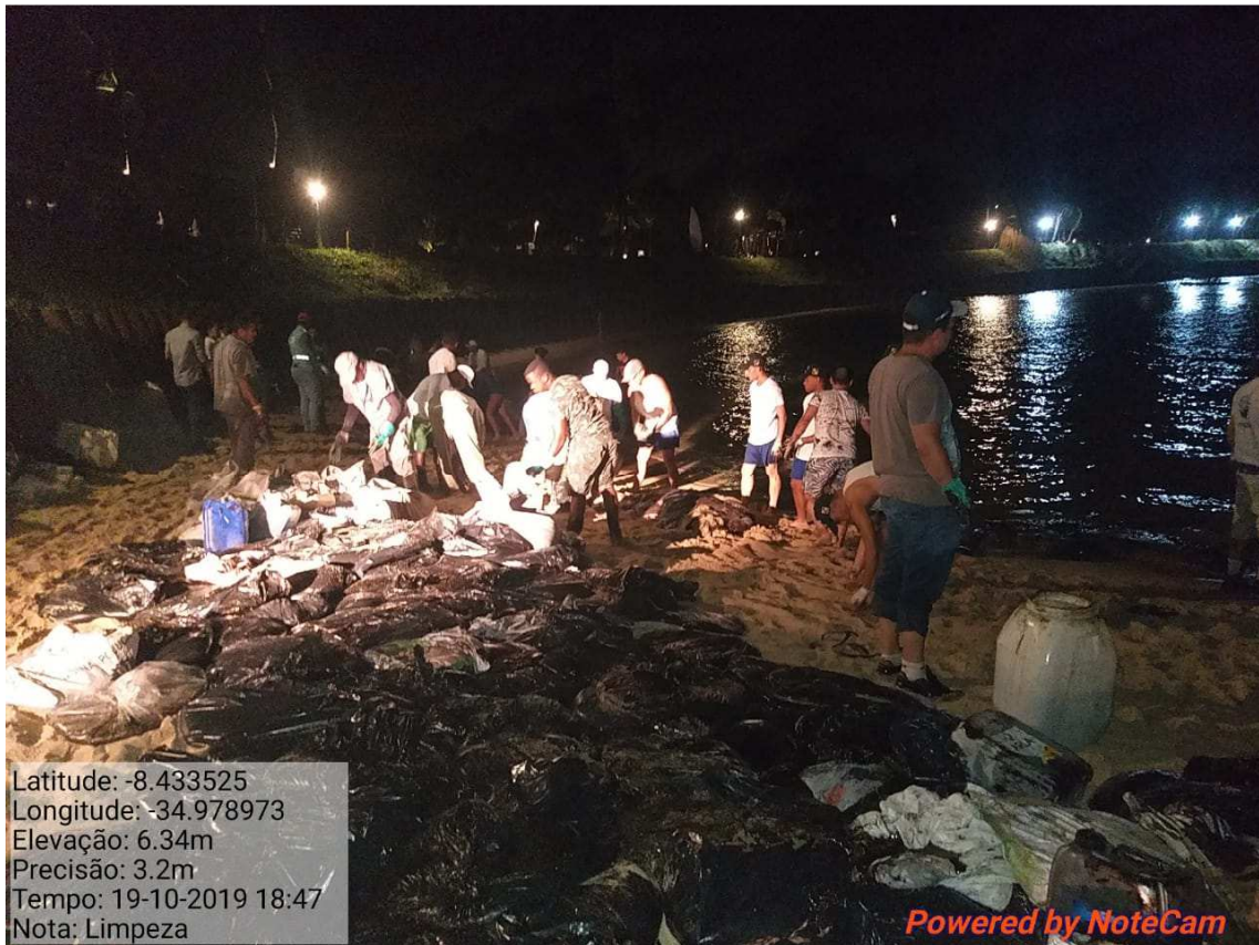
9. Limpeza na praia de Ipojuca- PE