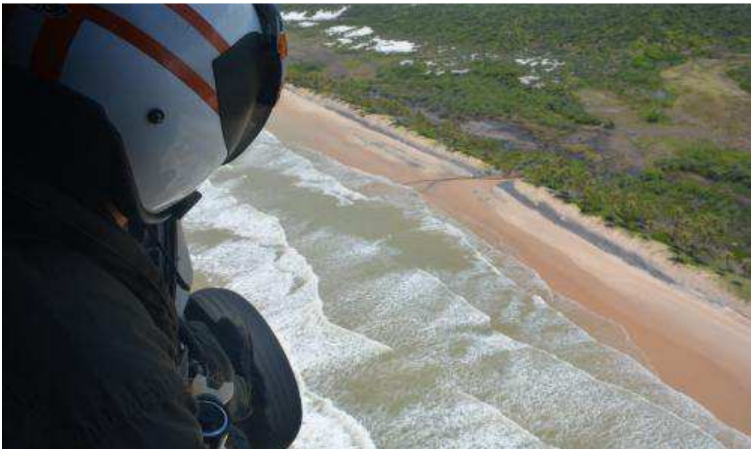
2. Buscas realizadas por aeronaves da MB