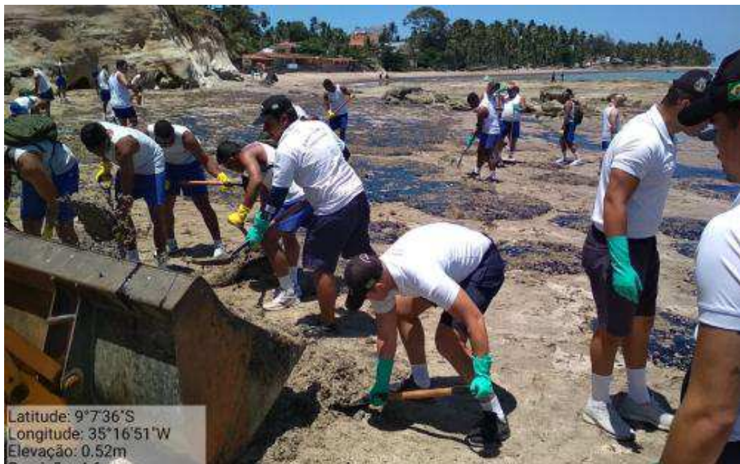
4. Limpeza no Pontal do Boqueirão- AL