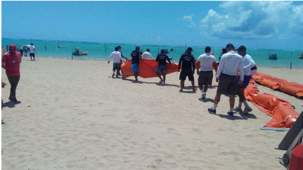
3. Colocação de barreiras de contenção na praia de Gravatá – PE