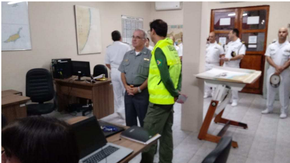
10. Visita do Comandante de Operações Navais