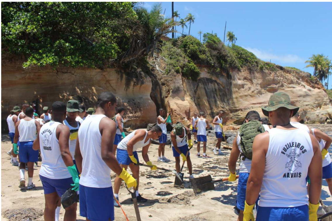
6. Limpeza na Praia de Japaratinga- AL