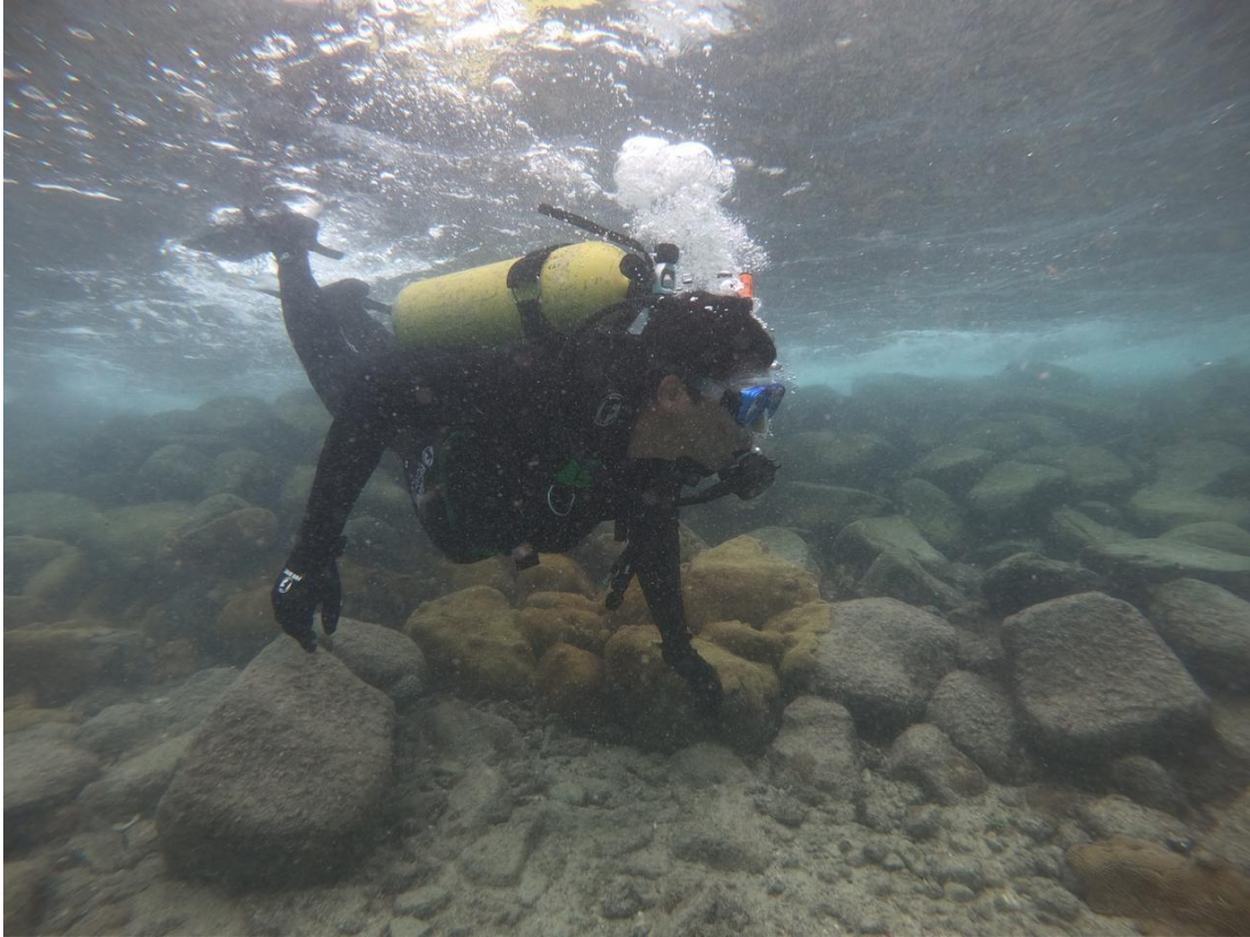
Ilha de Siriba, Arquipélago de Abrolhos-BA, limpa