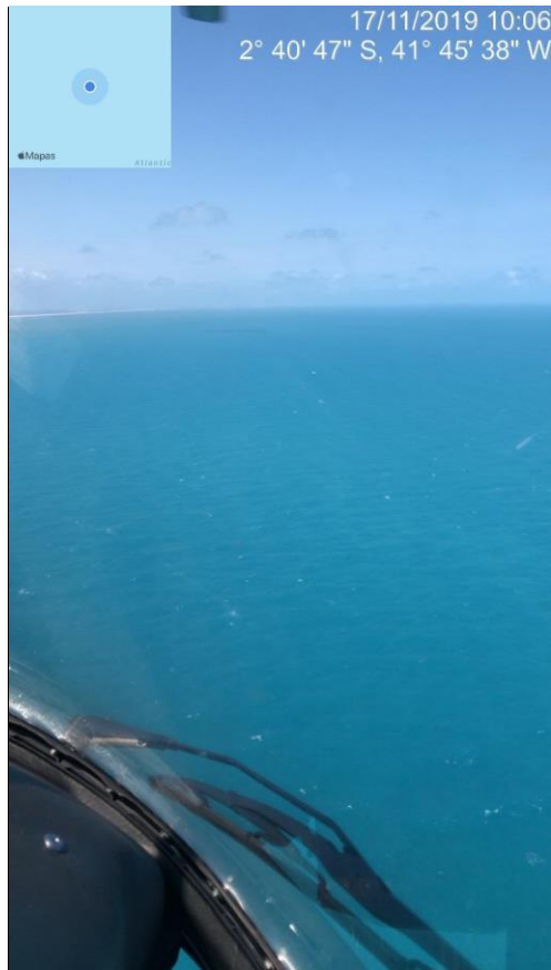
Ações de monitoramento aéreo-PI