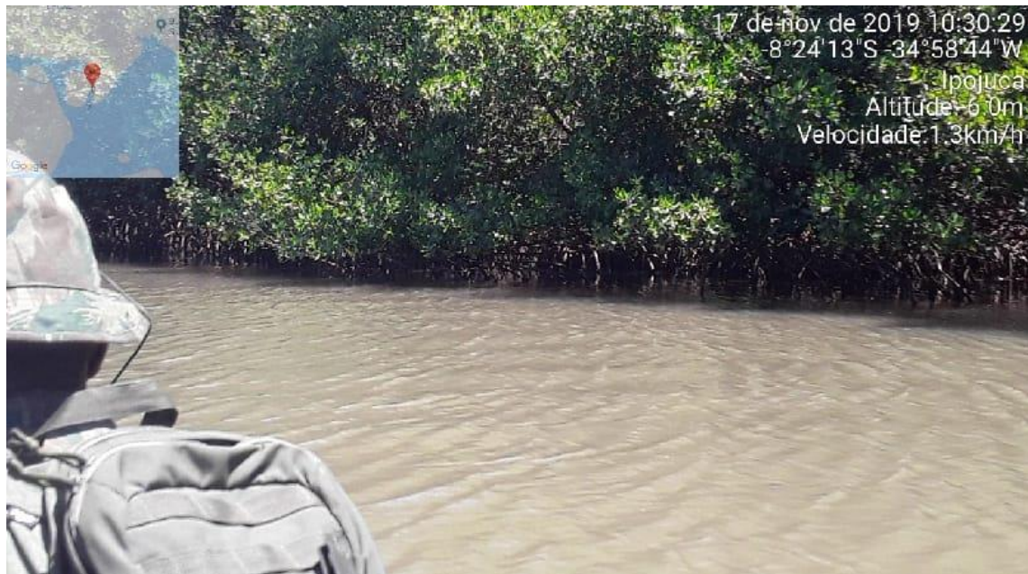
Ações de monitoramento embarcado no Rio Ipojuca-PE