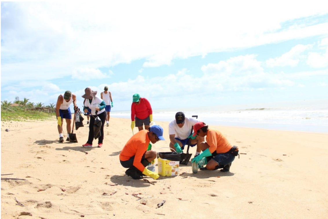
Ação Cívico-Social em Viçosa-BA