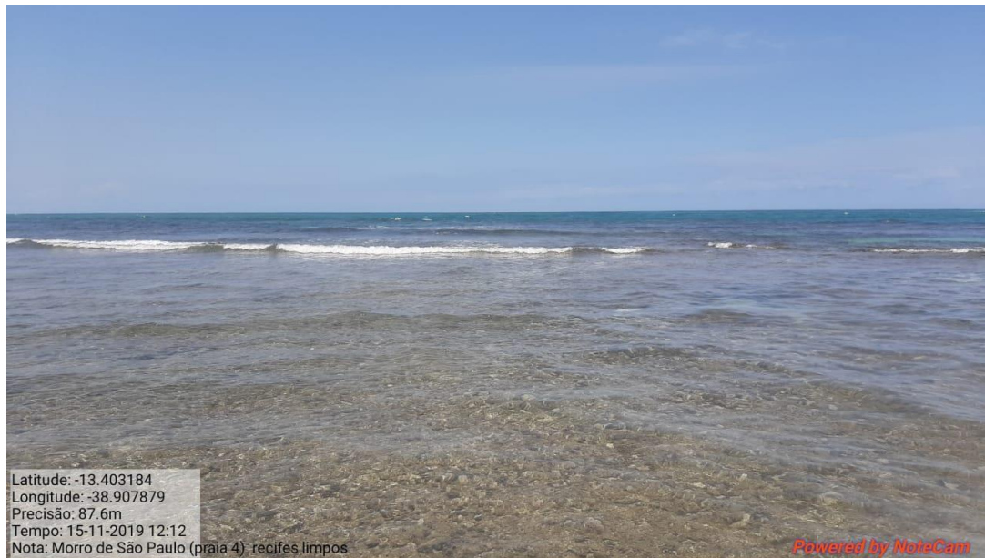
Praia de Morro de São Paulo-BA limpa