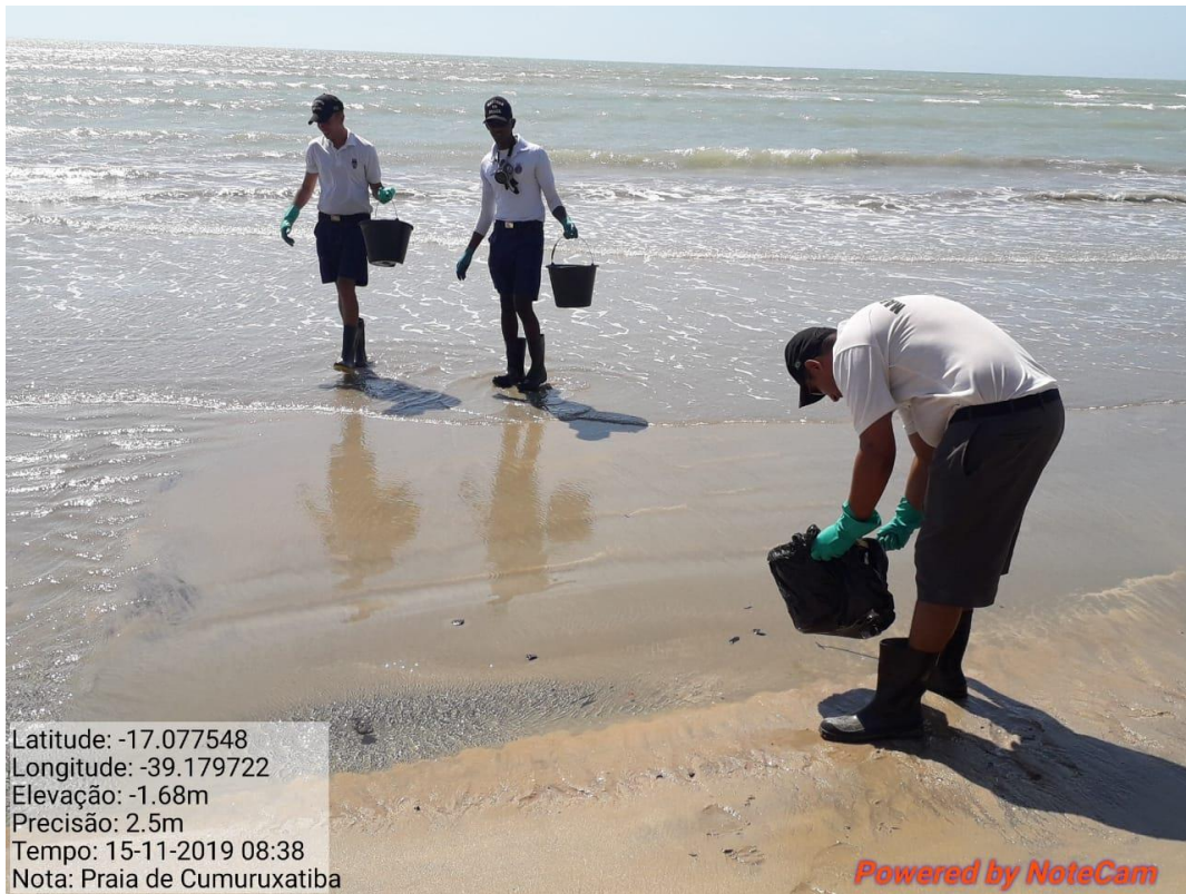
Ações de limpeza na Praia de Cumuruxatiba-BA