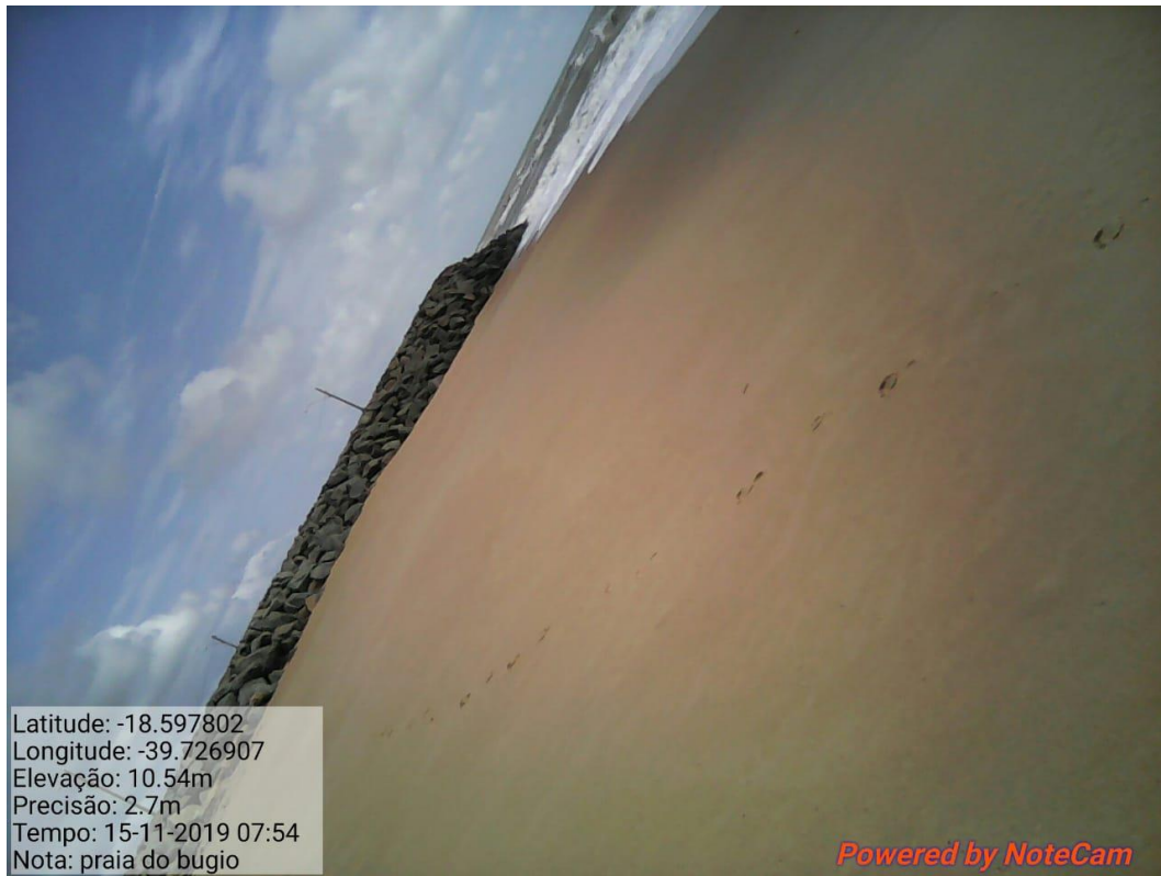
Praia de Conceição da Barra-ES limpa