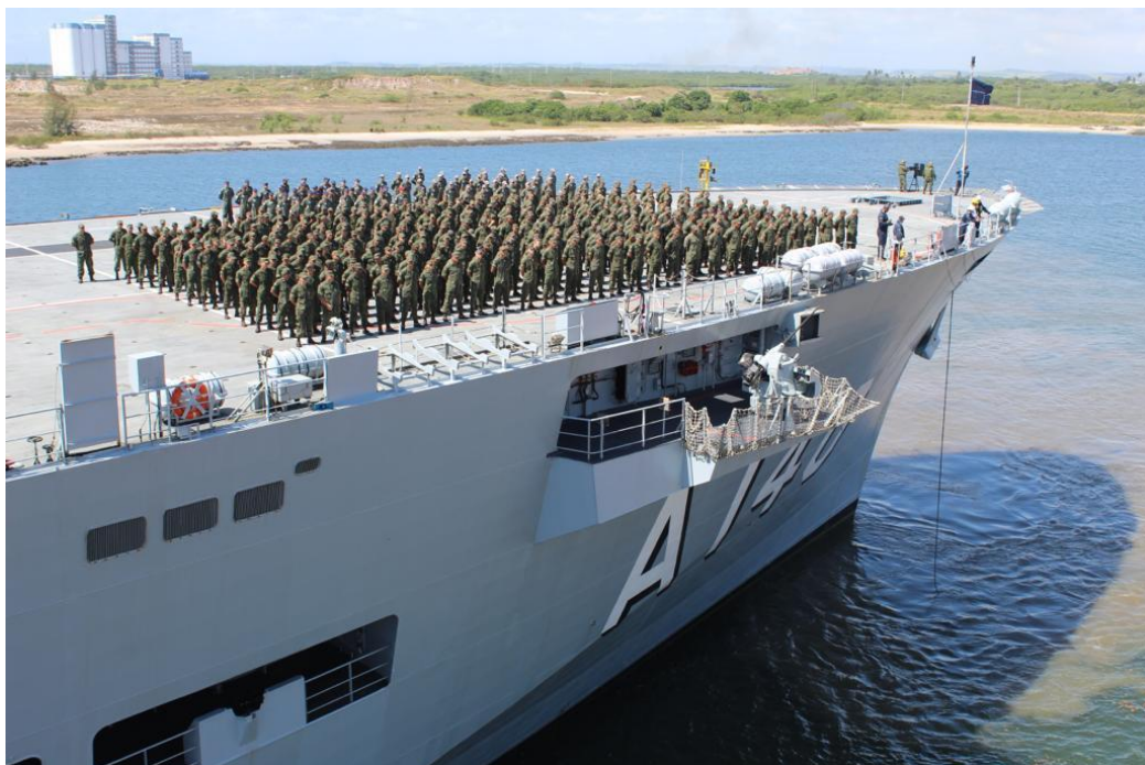
Tropa formada no PHM Atlântico atracado no Porto de Suape-PE