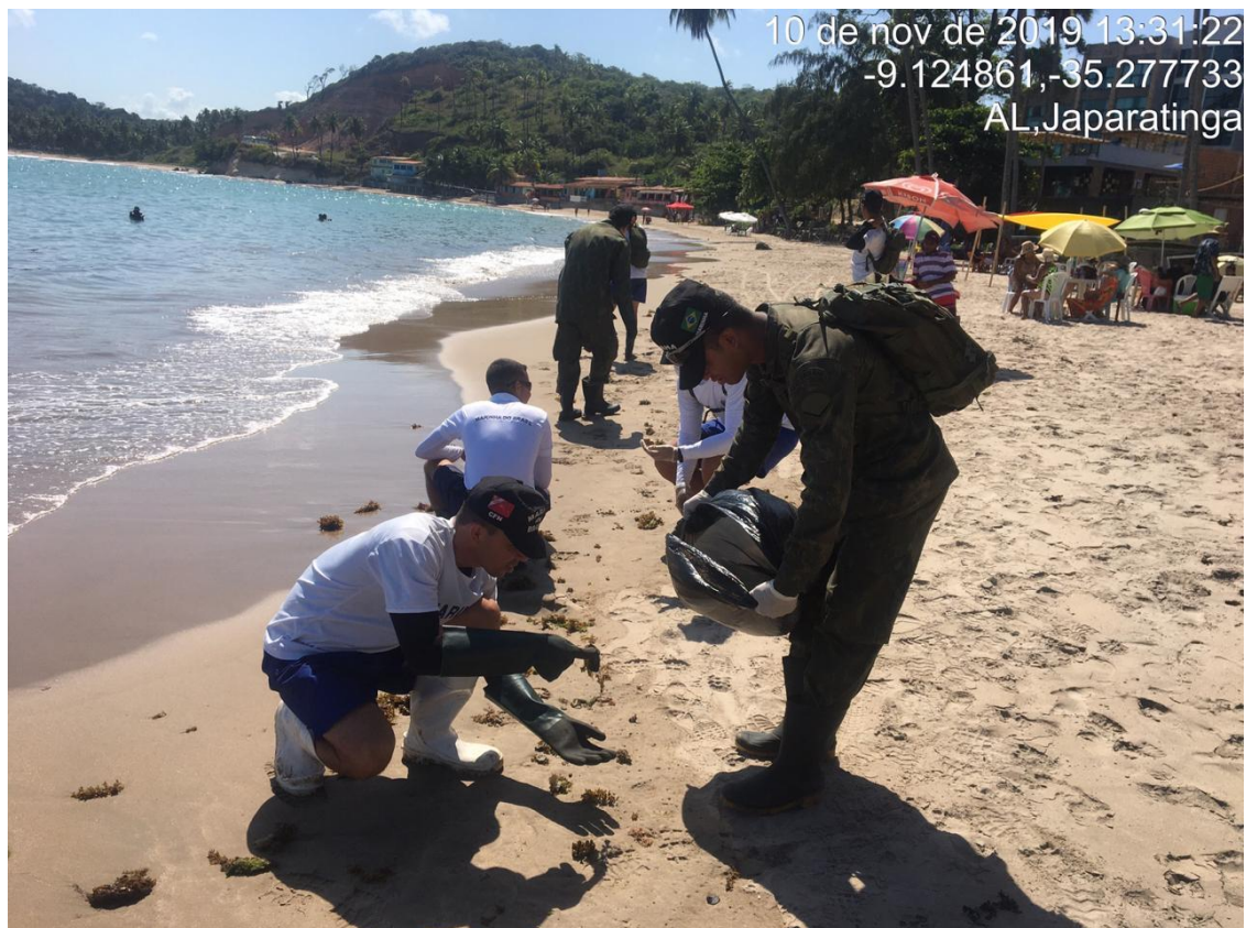
Ações de limpeza na Praia Japaratinga-AL