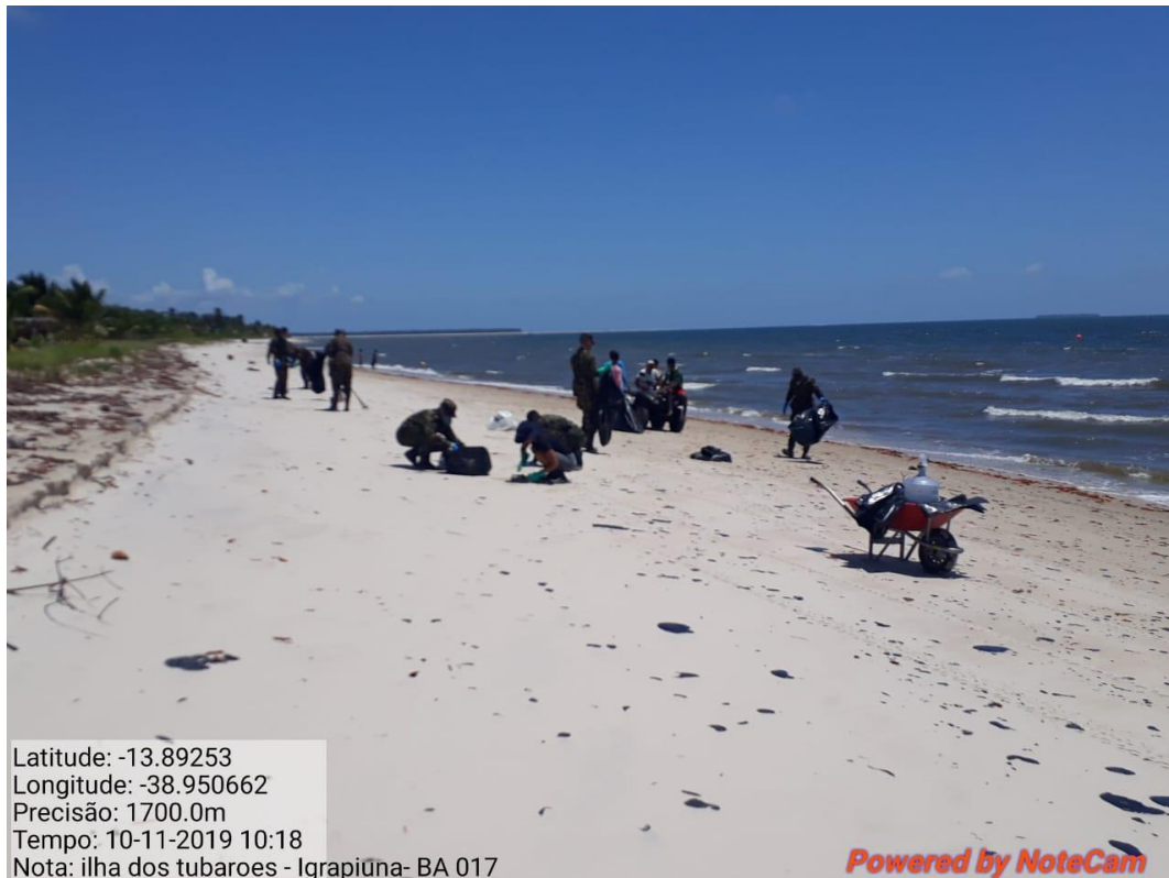
Militares do EB em ações de limpeza na Praia de Igrapiúna-BA