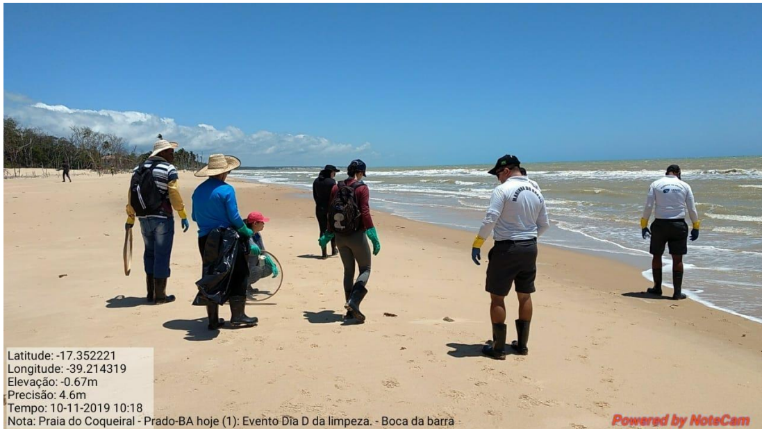
Ações de limpeza na Praia do Coqueiral-BA