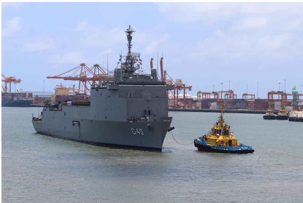
NDM Bahia atracando no Porto de Suape-PE