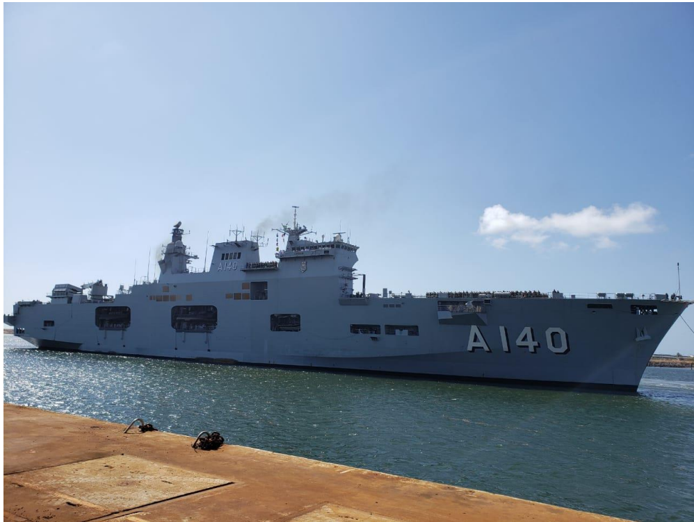
PHM Atlântico atracando no Porto de Suape-PE