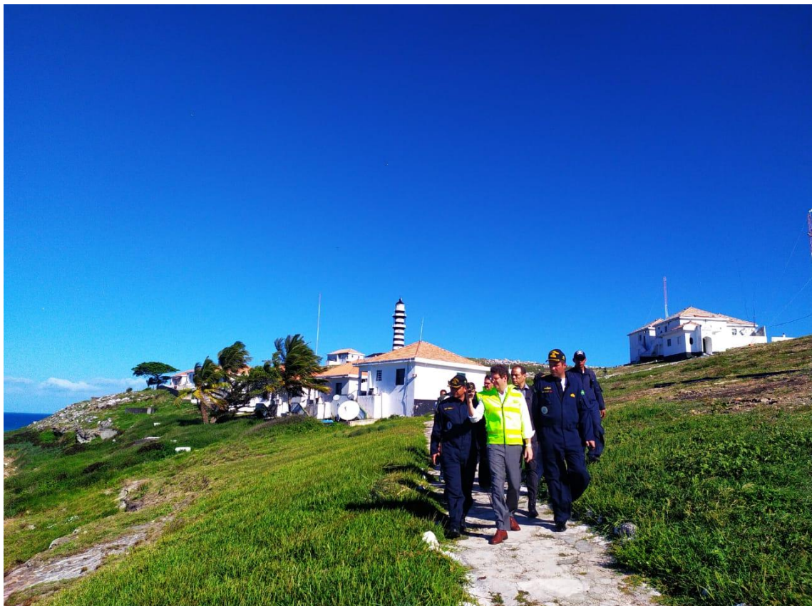
Ministro do Meio Ambiente em Abrolhos-BA