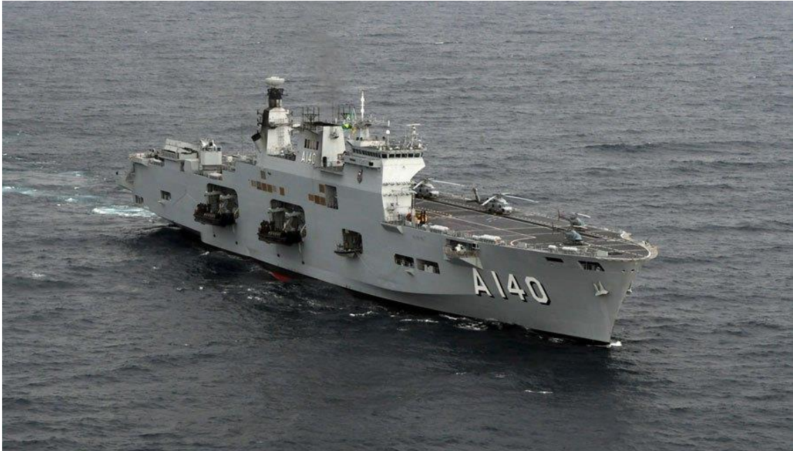
Porta-Helicópteros Multipropósito Atlântico