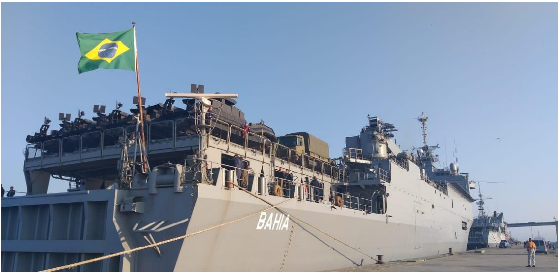
Navio Doca Multipropósito Bahia