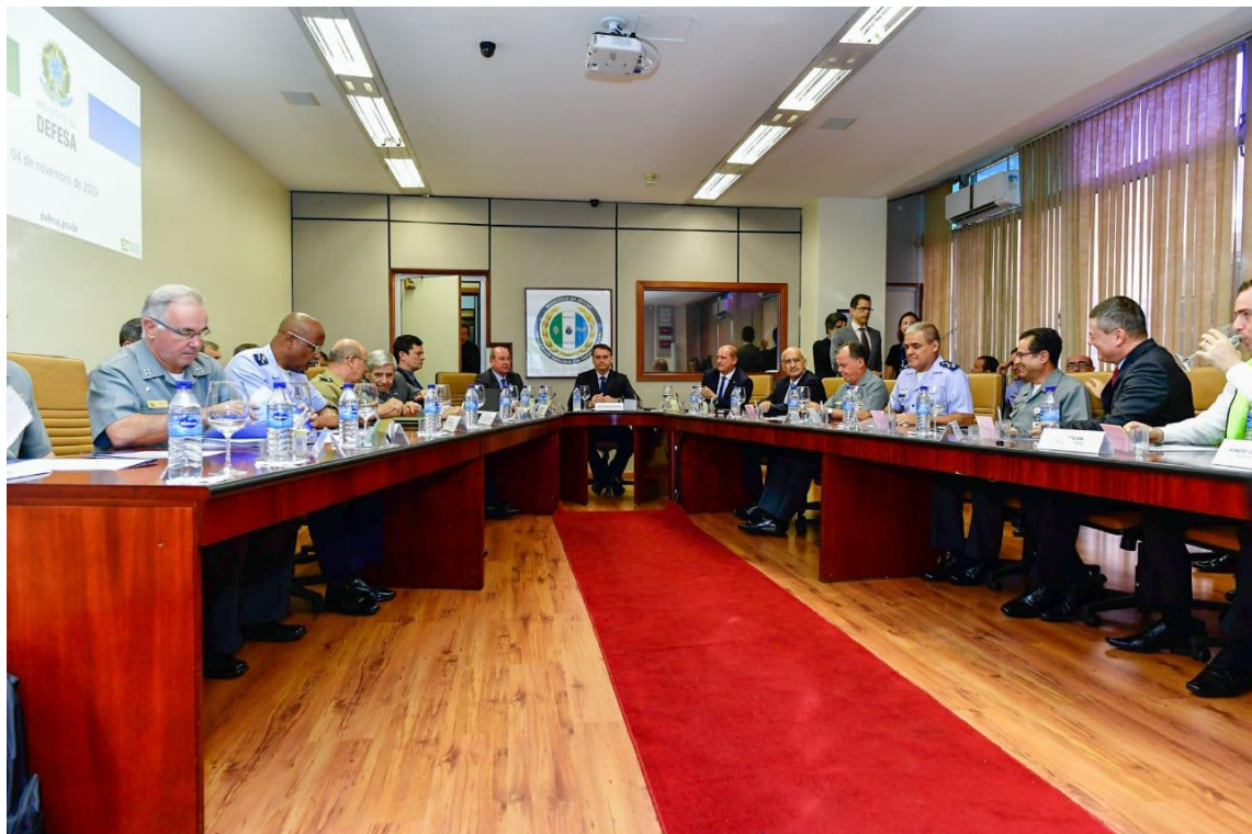
Presidente da República nas instalações do GAA