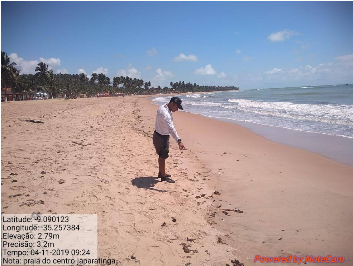
Ações de limpeza na praia de Japaratinga-AL