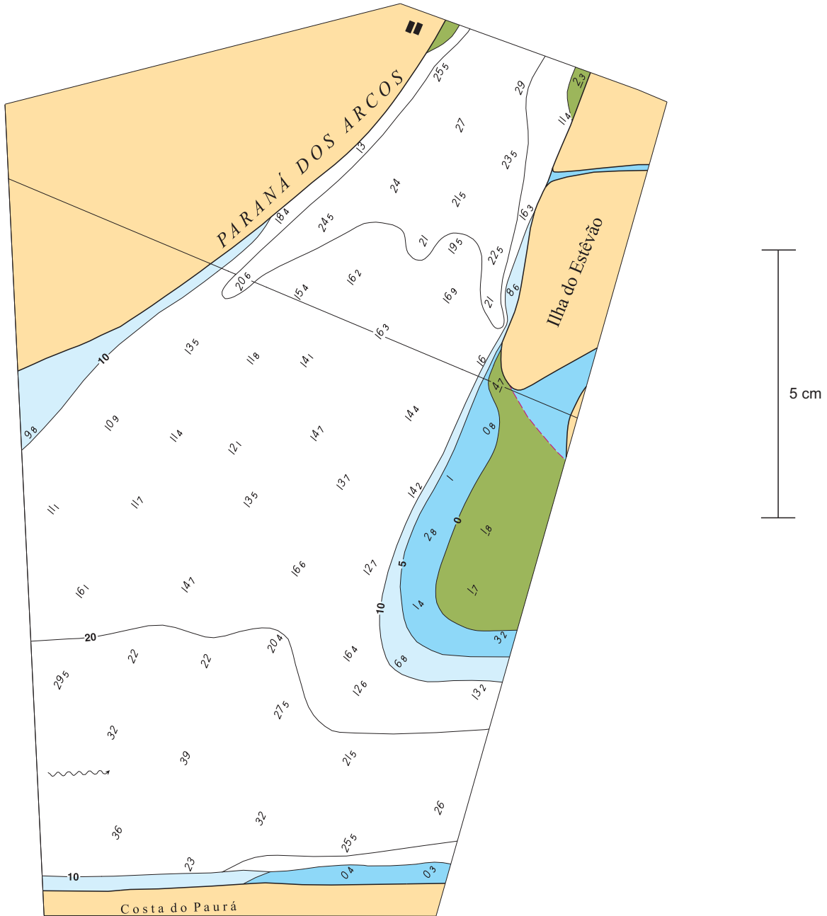
Block for Chart 4026 A - 1 st EDITION (Part 3). Correção para a Carta 4026 A - 1 a EDIÇÃO (Parte 3).

To accompany Notice No. I 136/22. Acompanha o Aviso Nº I 136/22.