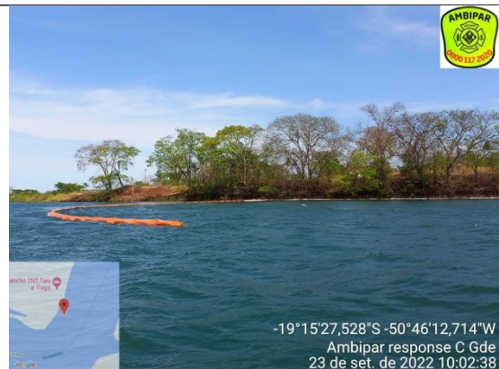
Final da barreira ao centro.