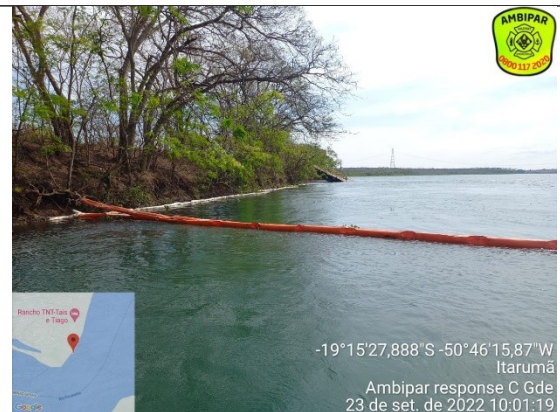
Início da barreira na margem à jusante do naufrágio